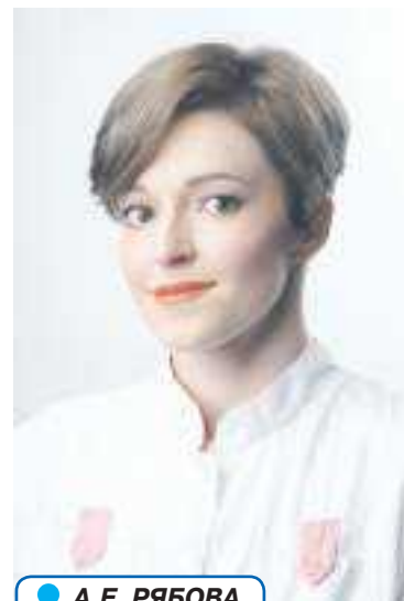
● А.Е. РЯБОВА

При себорейном дерматите наблюдается стадийность течения заболевания. Перхоть без ярко выраженного воспалительного процесса поддаётся терапии наружными средствами. Основой лечения является использование витаминных и минеральных комплексов, мазей, шампуней, лосьонов. Например, хороший эффект даёт применение комплекса Антисеборейный шампунь Диксидокс